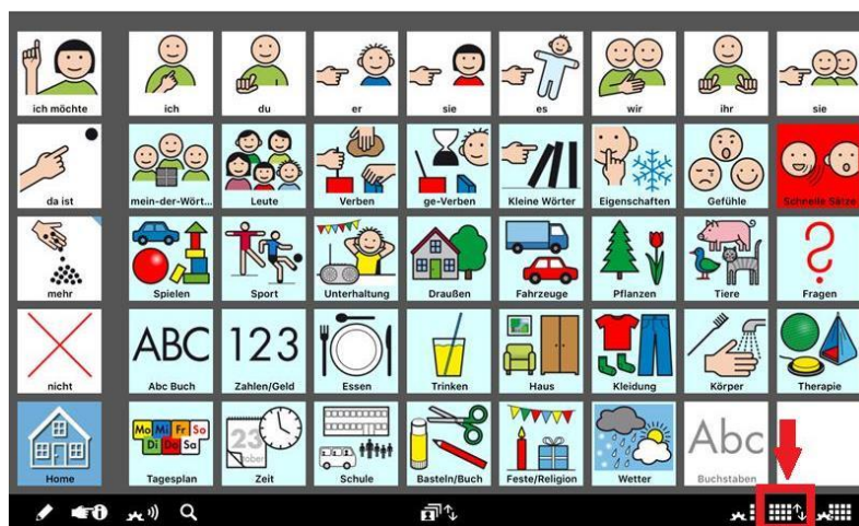
iPad mit Kommunikations-App „MetaTalk“